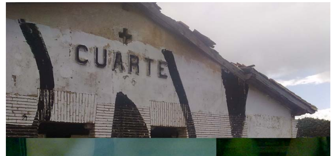
ESTACIÓN DE CUARTE. VISTA PRINCIPAL.