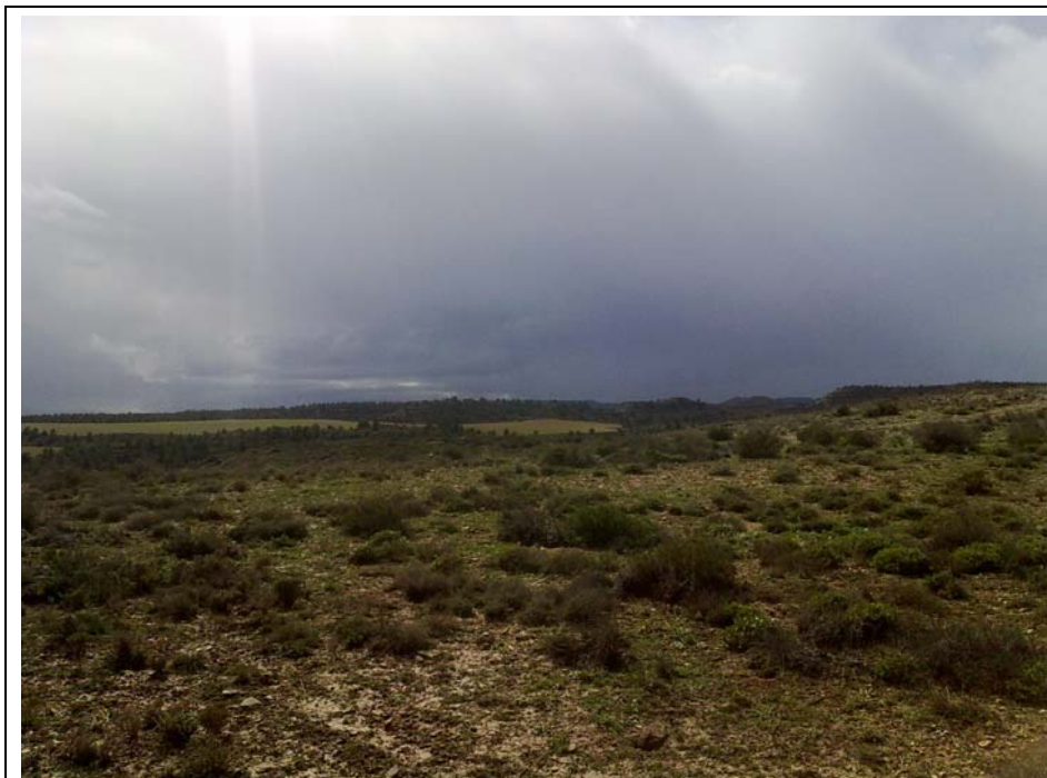
VISTA HACIA EL SUR. PAISAJE DESDE EL LÍMITE DEL CAMPO DE MANIBRAS.