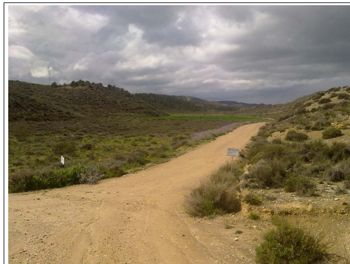
DESVÍO DEL CAMINO A-36. INICIO DEL CAMINO A-35.

Dada la proximidad y paralelismo entre ambos caminos, se ha optado por estudiar únicamente el camino A-35.