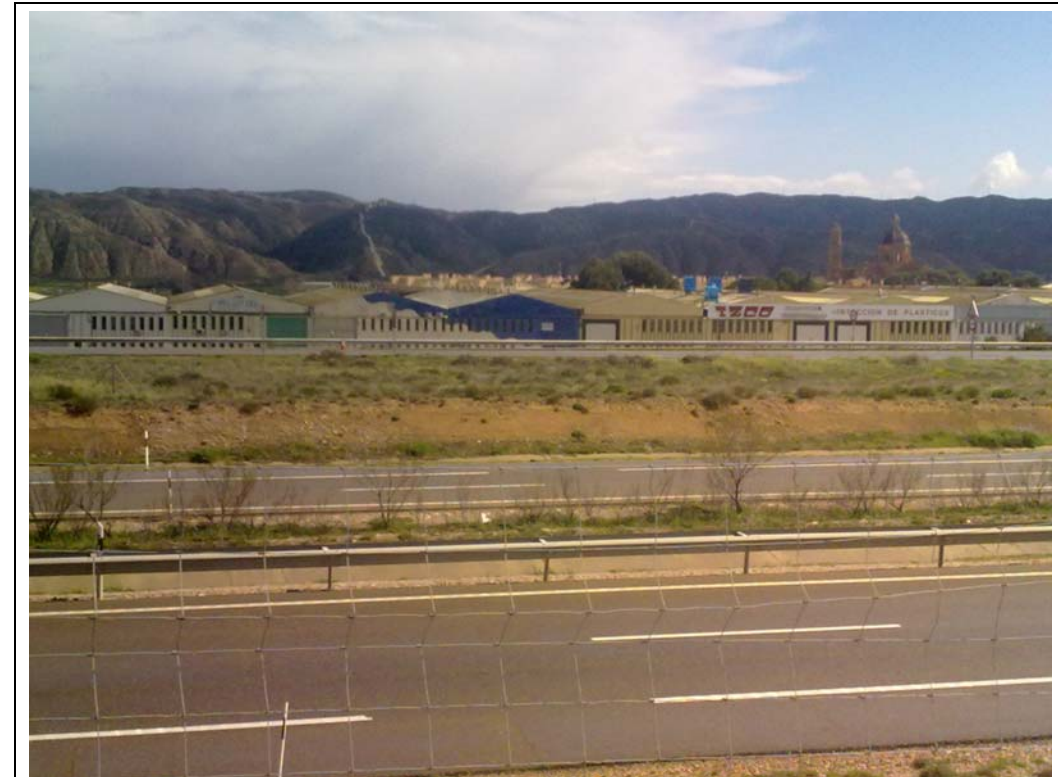
VISTA DEL POLÍGONO DE SANTA FÉ. (SITUADO FUERA DEL ÁMBITO).