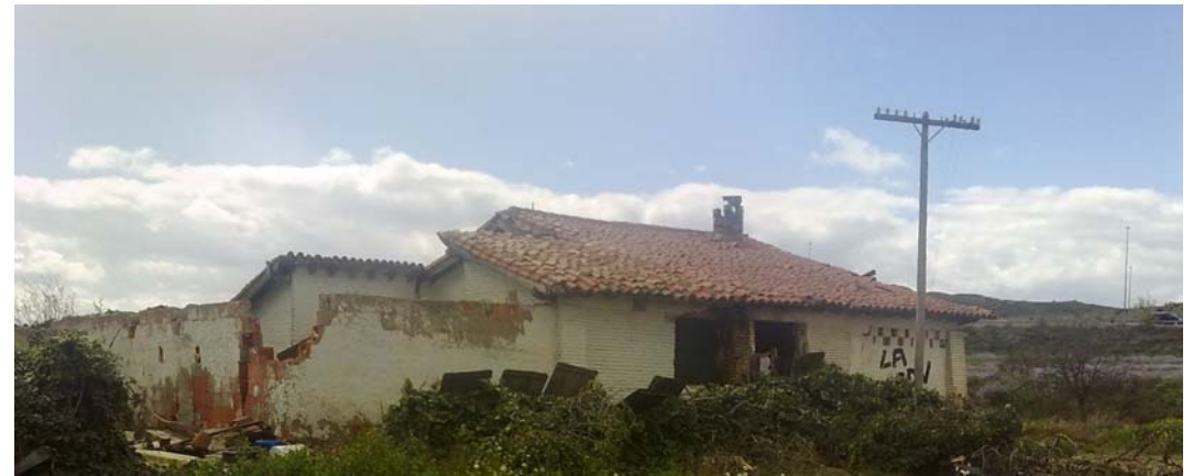
ESTACIÓN DE CUARTE. VISTA DESDE EL CAMINO OBJETO DE ESTUDIO.