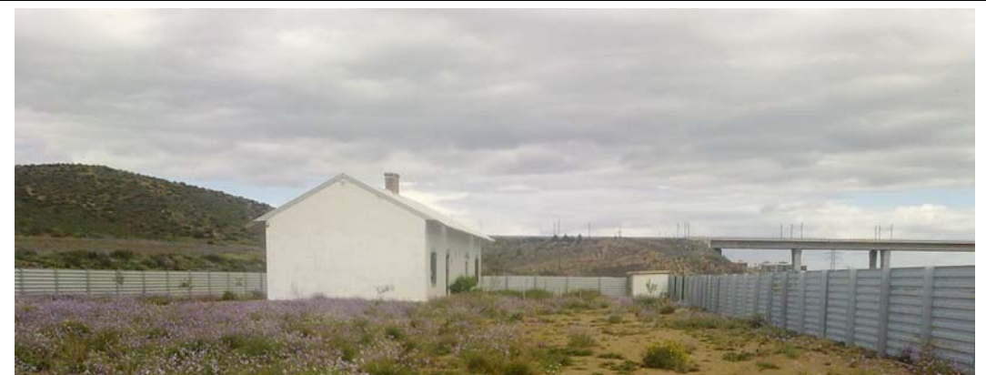
NUEVA INSTALACIÓN DE ADIF EN LAS INMEDIACIONES DE LA ESTACIÓN ABANDONADA