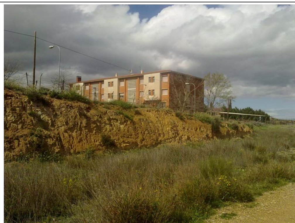
EDIFICACIONES RESIDENCIALES VINCULADAS A LA DEFENSA. (ZONA CENTRAL).

Cabe destacar que además del actividades y equipamientos anteriormente citados, inmediatamente antes de llegar al ámbito del campo de maniobras del Ministerio de la Defensa se ha detectado, tal y como puede observarse a continuación, la existencia de una fuente llamada Fita Santa Fé (ver plano I.1.6).