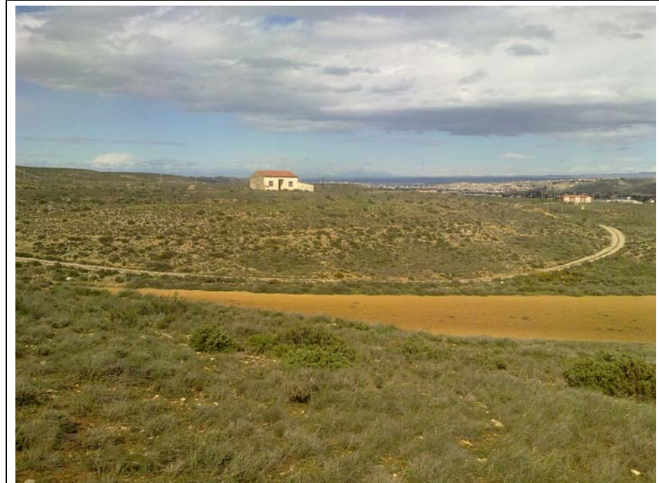
VISTA HACIA EL NORTE. CAMPO DE MANIOBRAS.

Una vez finalizado el ámbito del campo de maniobras y coincidiendo con el paso del ferrocarril por debajo de la autovía A-23 se llega a la parte final de este camino de propiedad municipal.