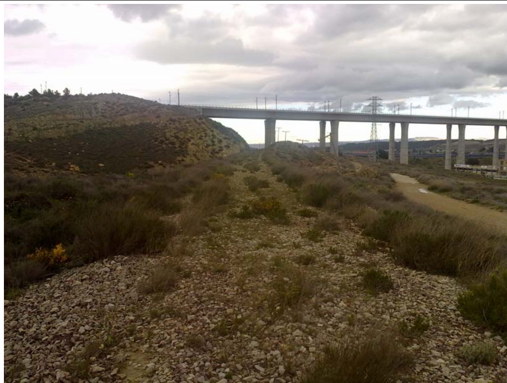
ANTIGUO RAMAL FERROVIARIO VISTO HACIAL EL NORTE.