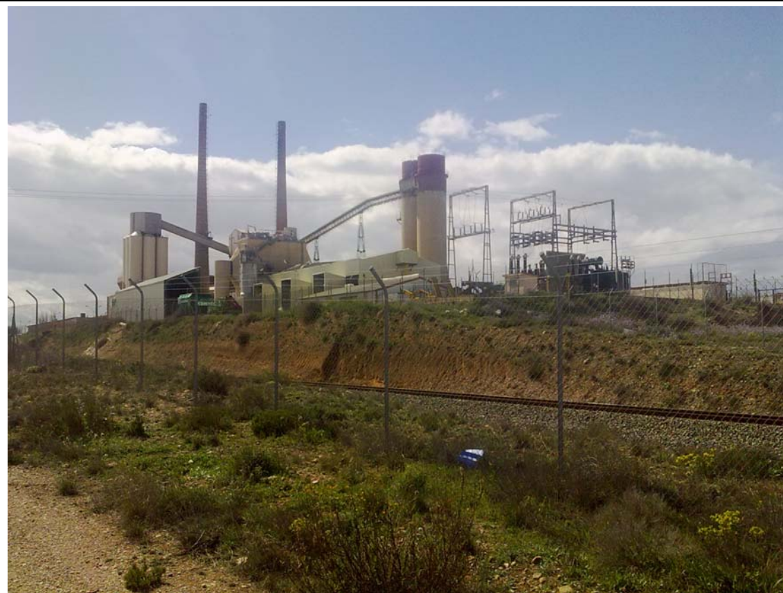
ACTIVIDADES INDUSTRIALES PESADAS.

Cabe destacar que inmediatamente antes y después de la industria pesada que a continuación puede observarse en la foto adjunta, existen varios caminos de acceso a zonas que disponen de una vegetación psícola de calidad media.