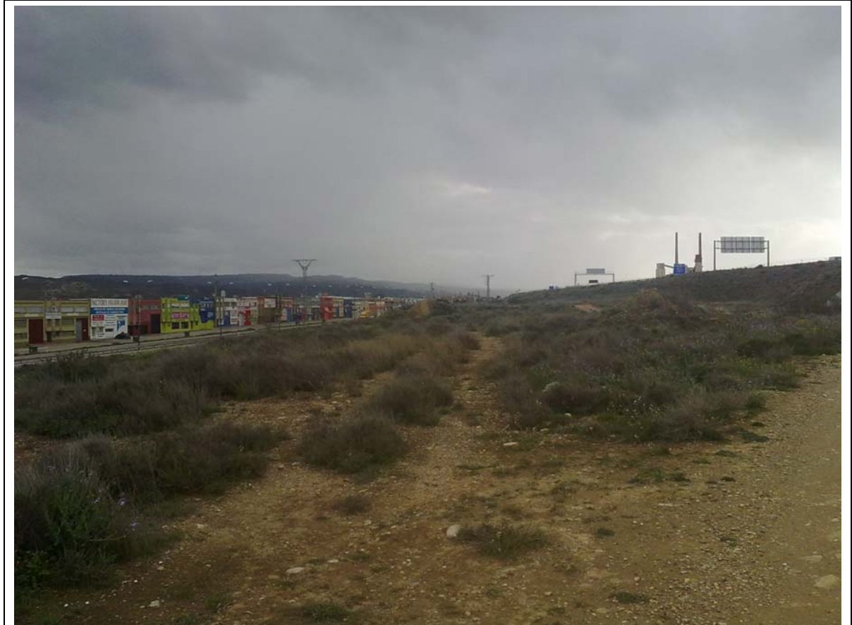
INICIO DEL CAMINO VISTO HACIA EL SUR. A LA IZQUIERDA: LA ANTIGUA CARRETERA A TERUEL Y EL POLÍGONO INDUSTRIAL DE CUARTE. A LA DERECHA: LA AUTOVÍA A-23.