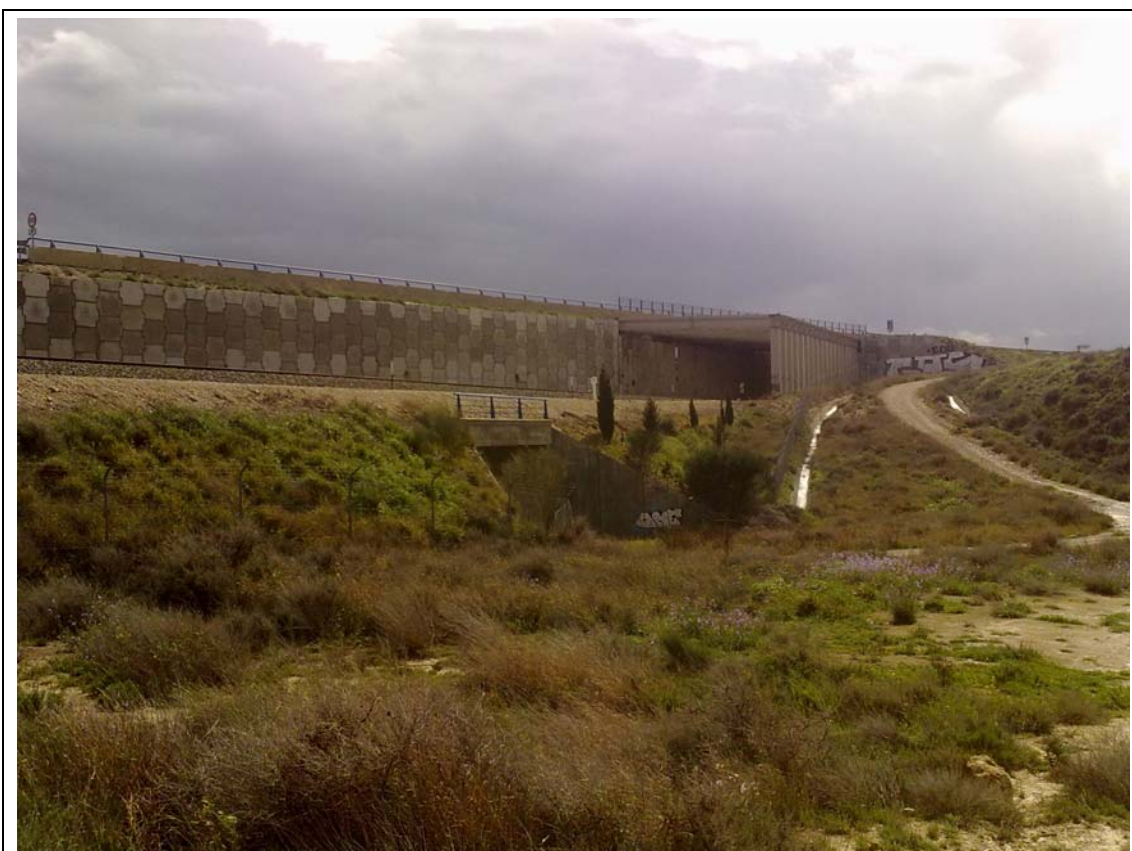
PASO DEL FERROCARRIL POR DEBAJO DE LA CARRETERA A-23.

Desde esta zona aparecen los desvíos a los caminos de propiedad municipal A-35 y A-34 que a continuación se procede a estudiar. (Ver plano I.1.6).