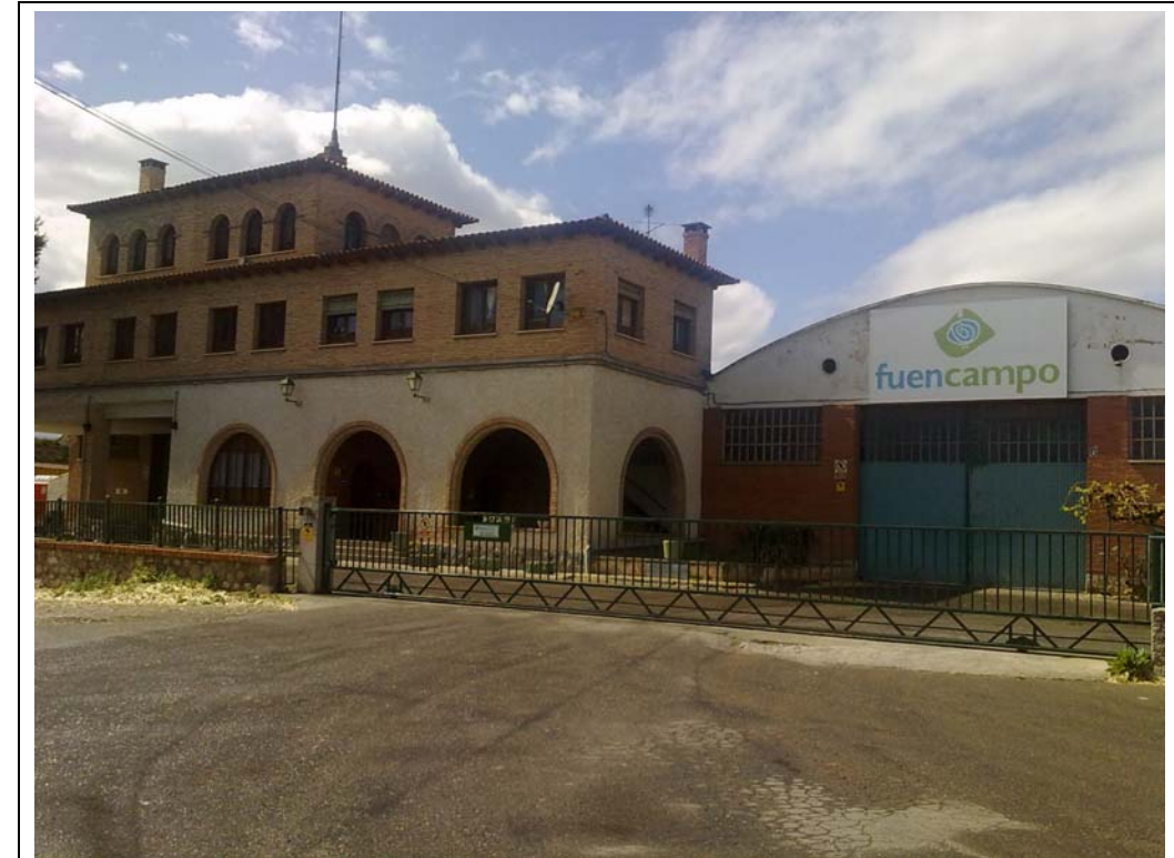
ACTIVIDADES INDUSTRIALES LIGERAS.

En el Plano de Ordenación PO-2, se propone calificar el camino existente entre las actividades industriales pesadas y la ciudad deportiva como Sistema General No Urbanizable del Medio Rural.