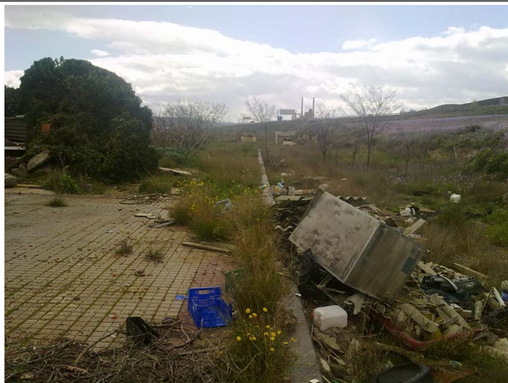
ANTIGUO RAMAL A SU PASO POR LA ESTACIÓN ABANDONADA DE CUARTE.