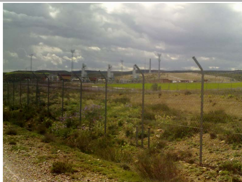
VISTA DE LAS INSTALACIONES MILITARES. (ZONA NORTE).