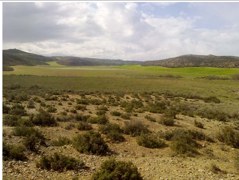
ACCESO CORTADO. ZONA ESTEPARIA DE CALIDAD MEDIA-ALTA.