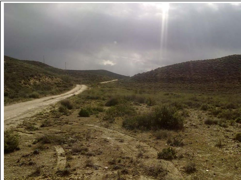
CAMINO CORTADO. ACCESO AL CAMPO DE MANIOBRAS.