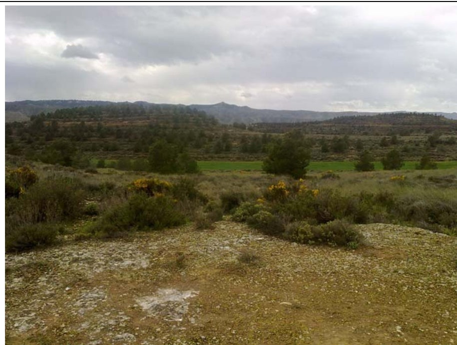
VISTA DESDE EL CAMINO A-35 HACIA EL SUR.