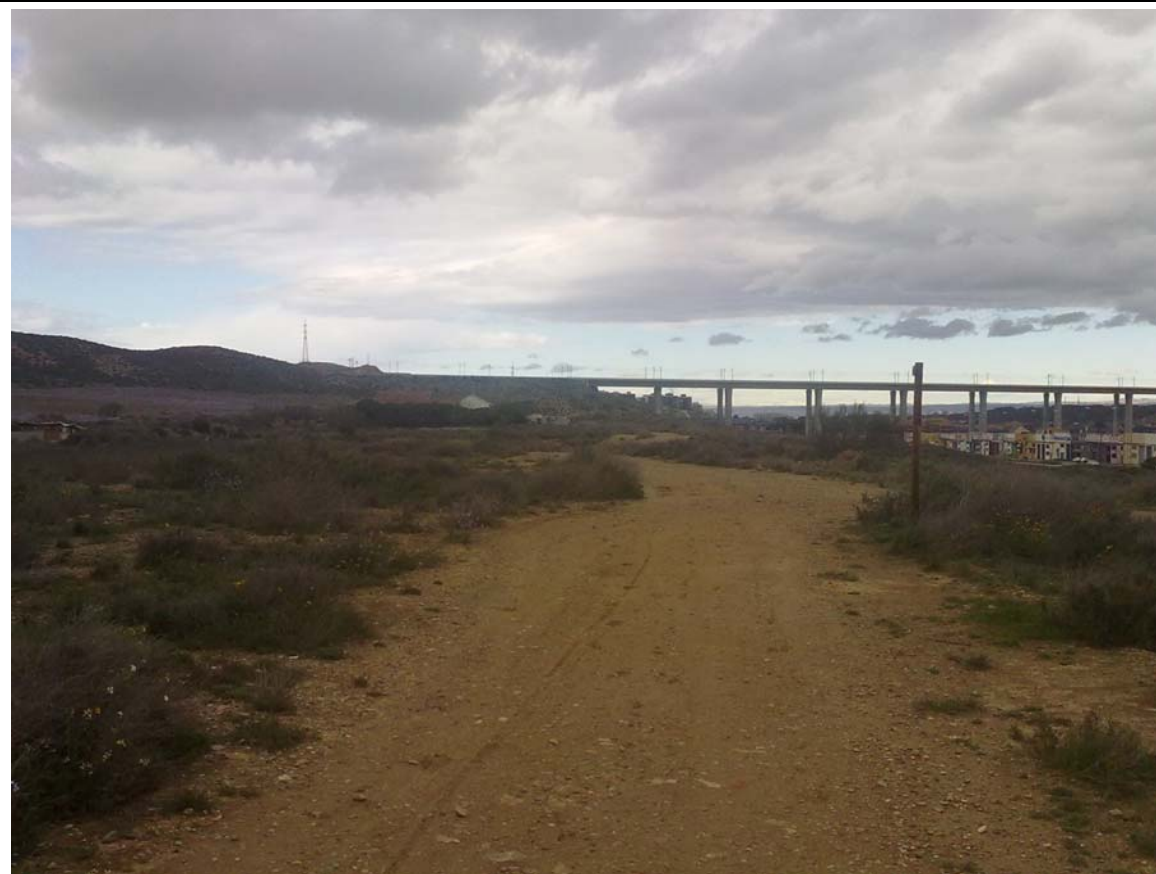
INICIO DEL CAMINO VISTO HACIA EL NORTE. PUEDE OBSERVARSE EL CUARTO CINTURÓN Y MÁS AL FONDO LA CIUDAD DE ZARAGOZA.

Este camino, definido como A-36 según plano I.1.4, no tiene un especial atractivo desde el punto de vista paisajístico debido a su cercanía a la autovía A-23, a la línea de ferrocarril Zaragoza-Teruel, así como a distintas actividades principalmente ligadas a la industria y a la defensa. Si bien, debido a la titularidad municipal del mismo, así como su cercanía a las citadas infraestructuras y al barrio de Valdespartera, se considera de interés como eje de conexión con otras zonas próximas que disponen de valores esteparios más altos.