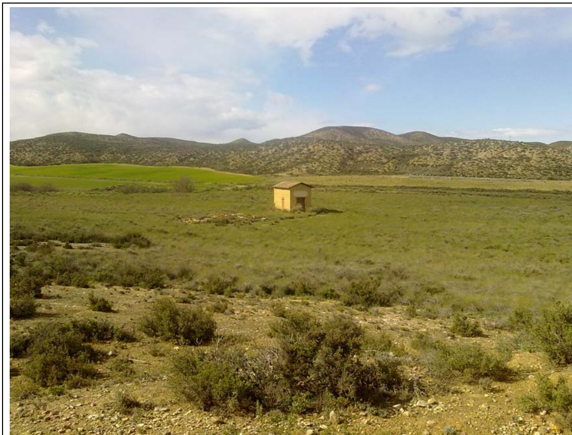
ÁMBITO DE LA FUENTE FITA SANTA FÉ.

Cabe destacar que además del actividades y equipamientos anteriormente citados, inmediatamente antes de llegar al ámbito del campo de maniobras del Ministerio de la Defensa se ha detectado, tal y como puede observarse a continuación, la existencia de una fuente llamada Fita Santa Fé (ver plano I.1.6).